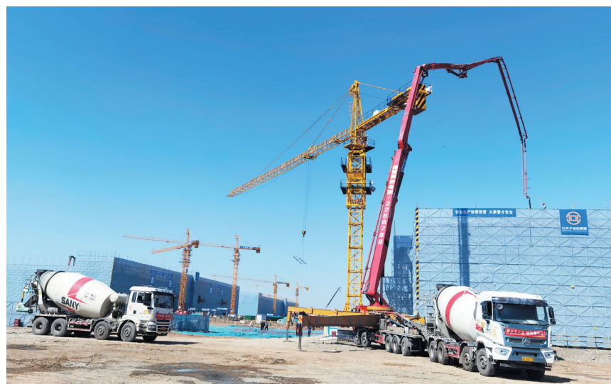
位于石河子高新技术产业开发区航空产业园临空装备制造东区的天域航空大型无人机和通航飞机生产基地项目4号综合车间实现封顶(摄于5月6日)。天域航空大型无人机和通航飞机生产基地项目总投资2.59亿元,占地244.57亩,计划今年7月底建成投用。届时,这里将生产出首架“兵团造”大型无人机。

在把牢粮食安全主动权的同时,兵团努力打造全国优质棉生产基地,提高管理水平,加强技术研发,“兵团造”高端采棉机驰骋田野,有力提升了棉花质量和综合生产效率,2023年棉花4项质