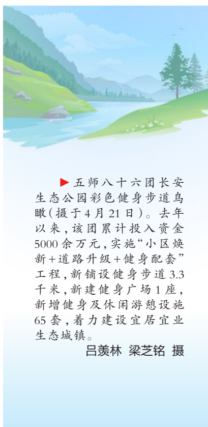
▶五师八十六团长安生态公园彩色健身步道鸟瞰(摄于4月21日)。去年以来,该团累计投入资金5000余万元,实施“小区焕新+道路升级+健身配套”工程,新铺设健身步道3.3千米,新建健身广场1座,新增健身及休闲游憩设施65套,着力建设宜居宜业生态城镇。

会上,中国新闻社总编辑张雷为兵团统战系统全体干部、兵团机关有关部门和中央驻疆、驻兵团新闻媒体单位作专题培训。