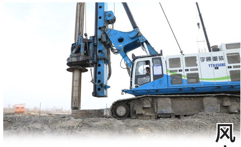
1月29日,G217阿拉尔至图木舒克公路项目二标段和田河特大桥施工现场。

1月29日,记者一行驱车从一师阿拉尔市西行,来到G217阿拉尔至图木舒克公路项目二标段和田河特大桥施工现场。下车时,寒风裹挟着沙粒打在身上,周围的灌木丛也被风吹得不停晃动,而在施工现场,却是一派热火朝天的繁忙景象:4台旋挖钻机不停作业,7辆吊车伸展长臂,将近3层楼高的巨型钢筋笼缓缓吊起,准确放入预先标好的桩位,机械运转声此起彼伏,在戈壁滩上回荡。