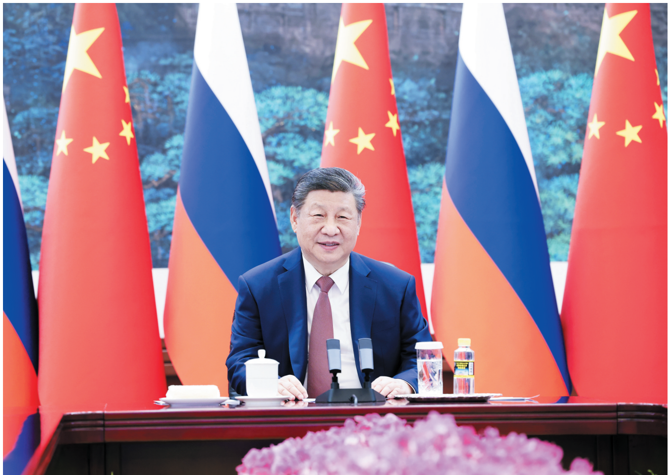
2月4日下午,国家主席习近平在北京人民大会堂同俄罗斯总统普京举行视频会晤。